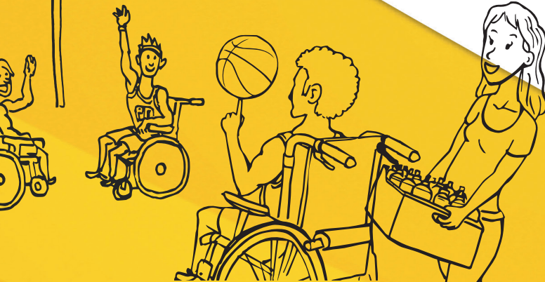
Grafik: LSB Niedersachsen e.V.